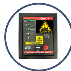
CENTRALINA ATS cod. 100726117-0002

Distribuito in esclusiva da: Prai s.r.l. Gravina in Puglia (BA)/Italy, 70024, via Nobel, 15/17 tel.: +39 080 325 58 17