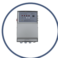
CENTRALINA ATS cod. 100725761-0001

Distribuito in esclusiva da: Prai s.r.l. Gravina in Puglia (BA)/Italy, 70024, via Nobel, 15/17 tel.: +39 080 325 58 17