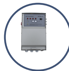
CENTRALINA ATS cod. 100725761-0001

Distribuito in esclusiva da: Prai s.r.l. Gravina in Puglia (BA)/Italy, 70024, via Nobel, 15/17 tel.: +39 080 325 58 17