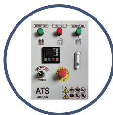
CENTRALINA ATS cod. CJX23204

Distribuito in esclusiva da: Prai s.r.l. Gravina in Puglia (BA)/Italy, 70024, via Nobel, 15/17 tel.: +39 080 325 58 17