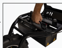
Contenitore batteria estraibile