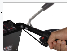
Comandi di direzione e velocità facilitati