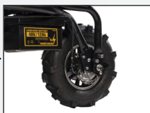
Freno a disco