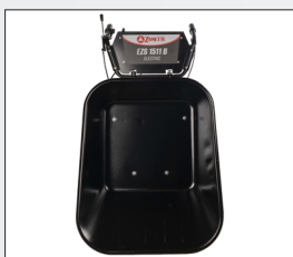
Cassone capiente 120 L