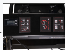
Cruscotto facile ed intuitivo con indicatore di livello di carica e voltaggio