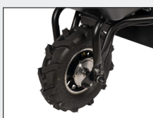
Motore rotativo brushless 500W - 48V