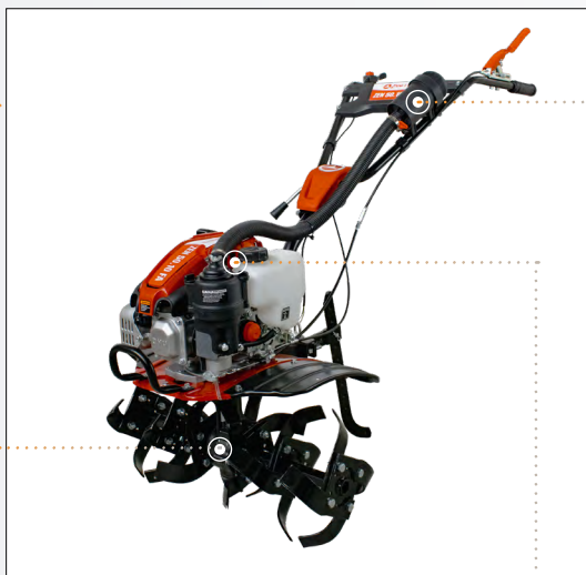
Albero fresa esagonale