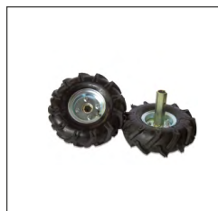
KIT RUOTE TRACTOR