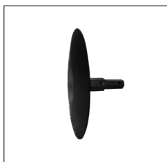
DISCO LATERALE FRESA