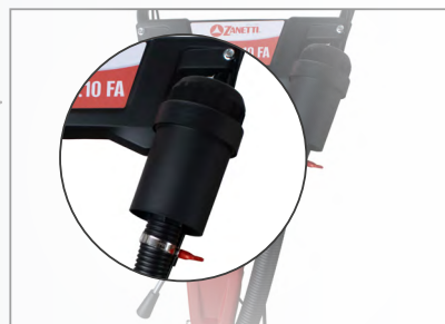
FILTRO ARIA 2 stadi SNORKEL