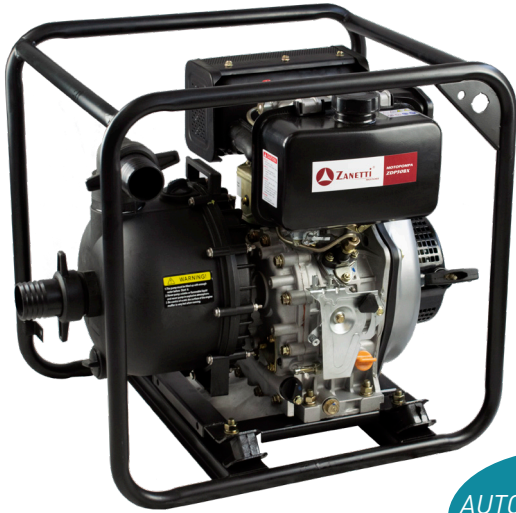
ZDP 50 BXV