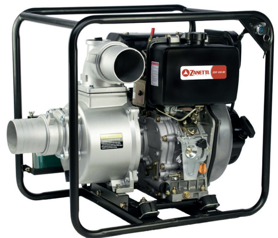
ZDP 100 BEV

Le motopompe a bassa prevalenza diesel da 2" a 4" sono un valido aiuto per chi deve irrigare a bassa pressione, irrorare, o semplicemente travasare acqua da un luogo ad un altro. La motopompa diesel da 3" per acque torbide con pompa ispezionabile è ideale per il travaso di acque sporche contenenti corpi solidi di diametro inferiore a 30 mm.