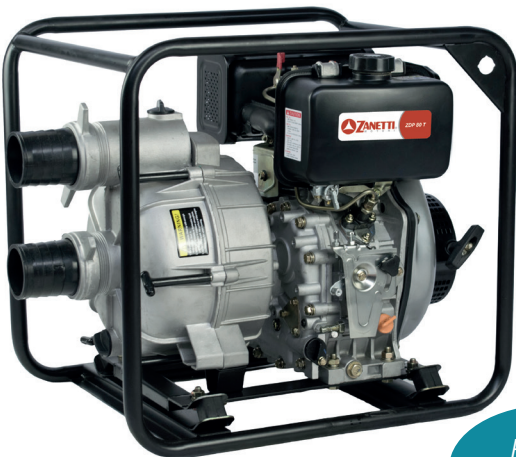
ZDP 80 TV