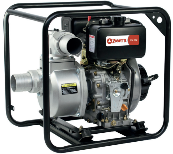
ZDP 80 B